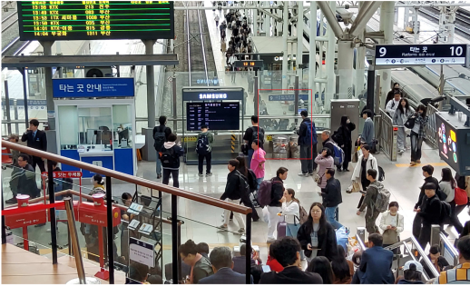
<서울역 승강장 입구>