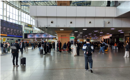
<서울역 2층 대합실>