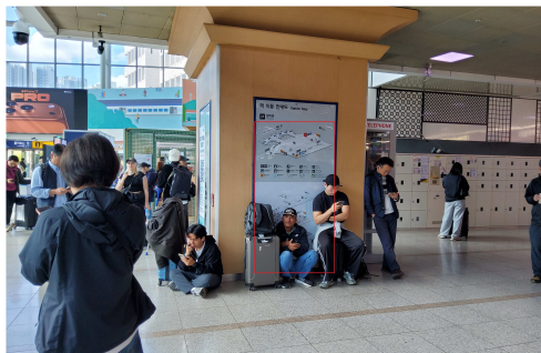
<서울역 2층 대합실>