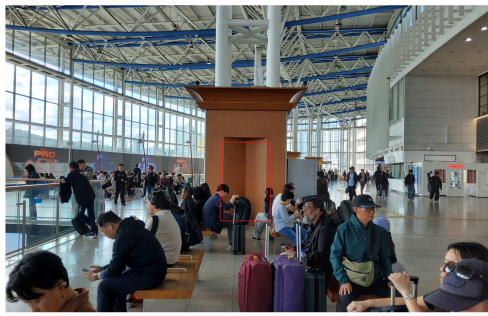
<서울역 3층 대합실>